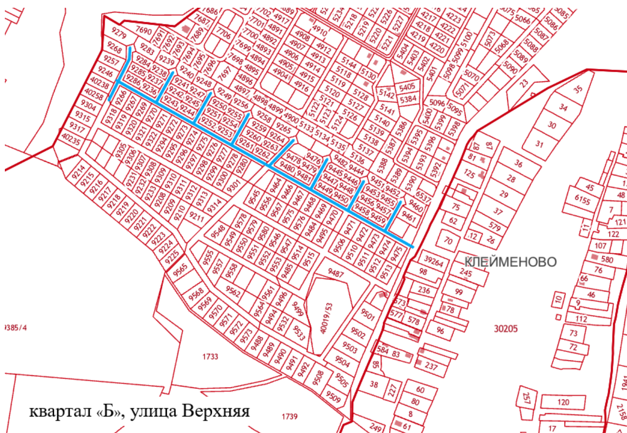
Схема расположения элементов улично-дорожной сети муниципального образования «Городской округ Серпухов Московской области» на кадастровом плане территории