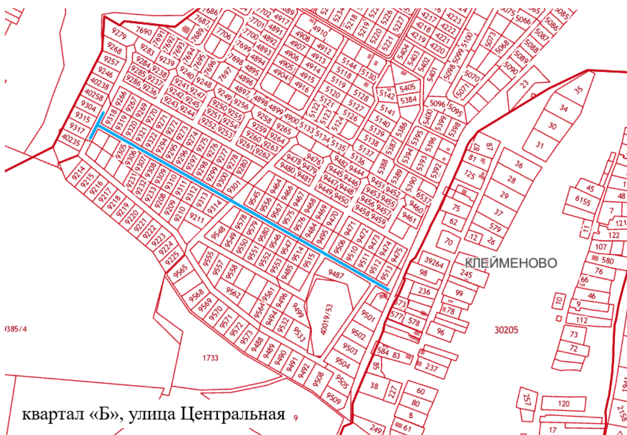
Схема расположения элементов улично-дорожной сети муниципального образования «Городской округ Серпухов Московской области» на кадастровом плане территории